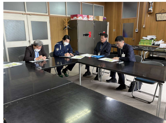
警察官を交えた意見交換